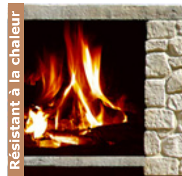
Résistant à la chaleur

Pose: les pierres sont posées individuellement contre les murs avec mortier colle. Composition: béton léger. Poids approximatif: 40 Kg/m 2 . Epaisseur approximative: 3 à 4 cm. Couleurs: les couleurs sont une partie intégrante de la préfabrication. Résistance contre le feu: produit non combustible.