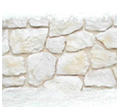
Résistant au gel

Pose: les pierres sont posées individuellement contre les murs avec mortier colle. Composition: béton léger. Poids approximatif: 40 Kg/m 2 . Epaisseur approximative: 3 à 4 cm. Couleurs: les couleurs sont une partie intégrante de la préfabrication. Résistance contre le feu: produit non combustible.