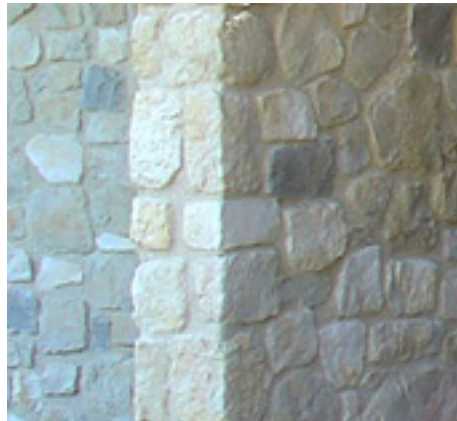
Angle Pierre de Provence

L'emploi des éléments d'angle donneront un design supplémentaire à vos réalisations.